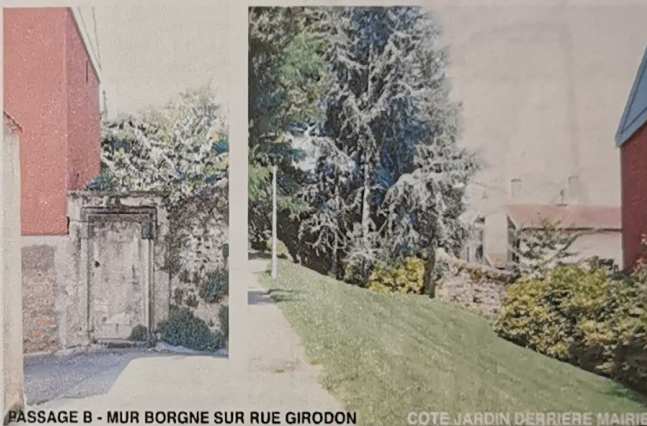
PASSAGE B - MUR BORGNE SUR RUE GIRODON