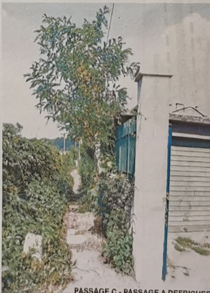
PASSAGE C - PASSAGE A DEFRICHER