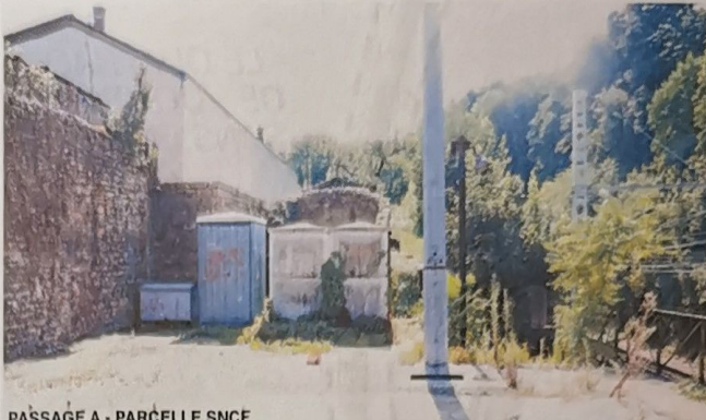
PASSAGE A - PARCELLE SNCF